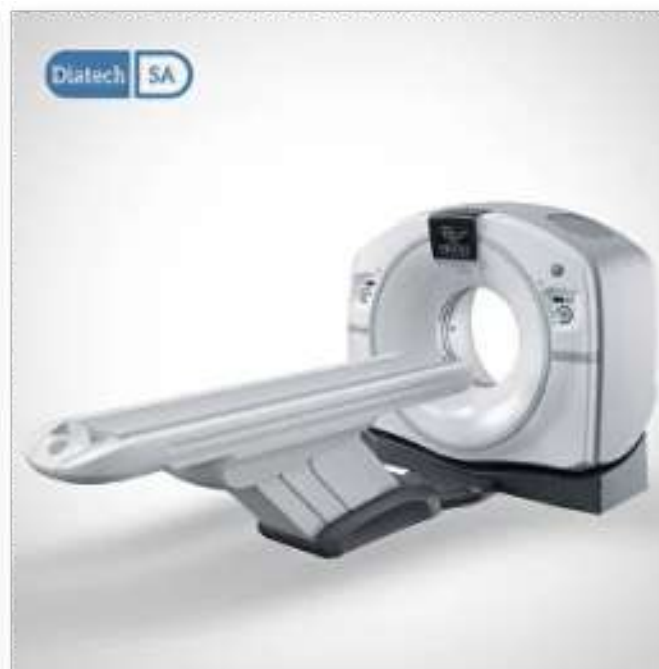
GE Revolution Evo 5454001-60