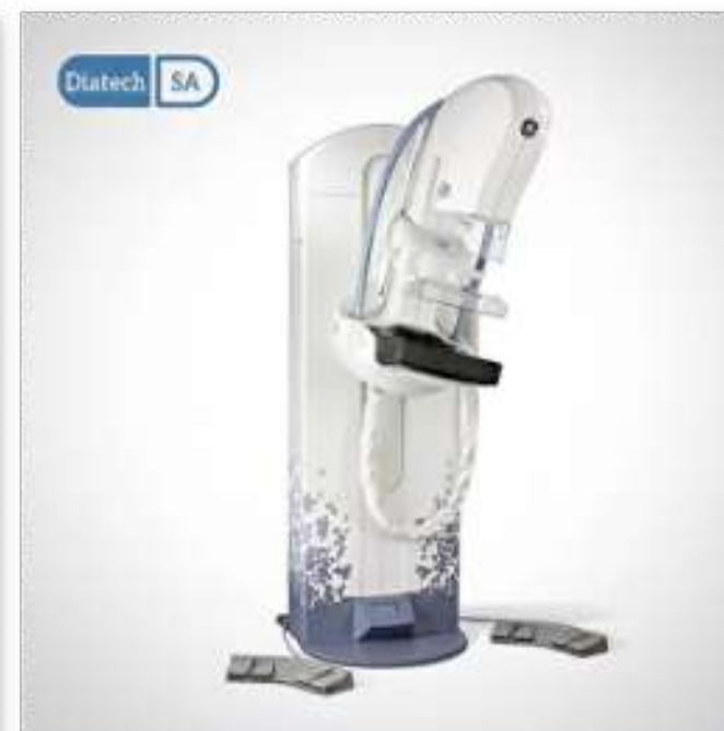
GE apollon (маммограф)