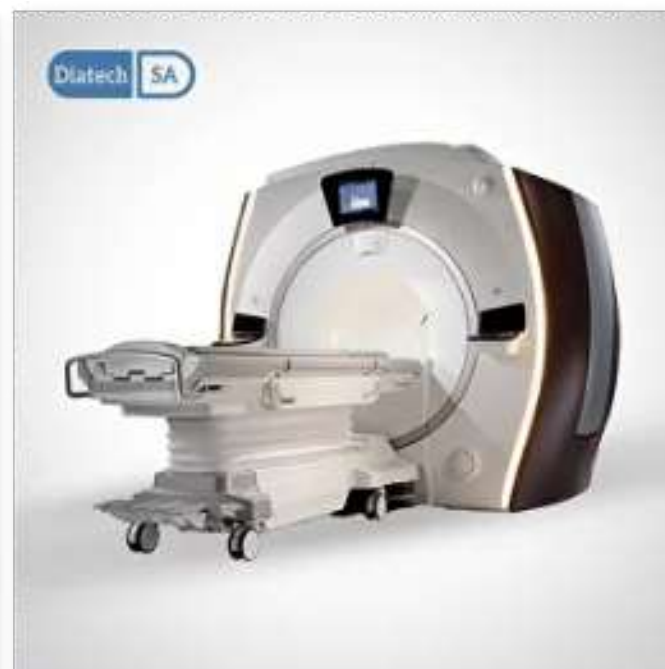
GE Optima mr450w